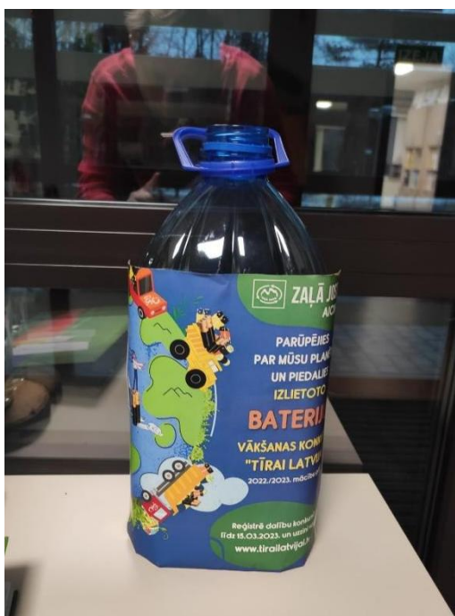
Bateriju vākšana dienesta viesnīcā Aizupes

Ogres tehnikuma Ekopadome pateicas visiem, kuri piedalījās izlietoto bateriju vākšanas konkursā "Tīrai Latvijai". Nepilnu divu mēnešu laikā mums izdevās savākt 58,65 kg izlietoto bateriju. Dienesta viesnīcās no kopējā skaita savāca 9kg ( DV Jaunatnes iela3- 4,5 kg, DV "Aizupes"- 2,5kg, DV Upes pr.18- 2kg).