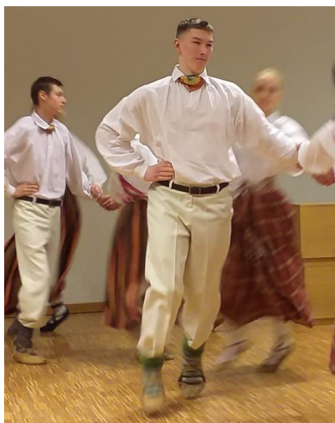
DV Upes pr.18 Deju kolektīvs "Upmaliņas"