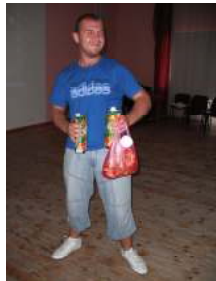
Šoreiz 4. grupai ceturkā vieta ☺