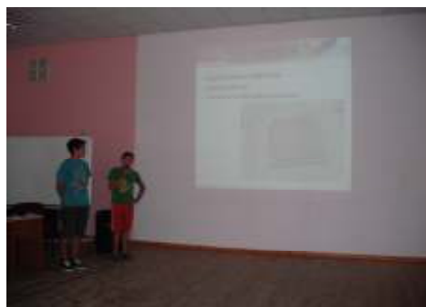
Mājas darba prezentācija – „Kā kļūt par elektronīķi”