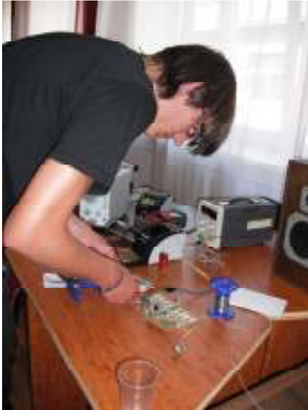
Pēc shēmas salodēšanas tika pārbaudīts tās darbspējīgums, pieslēdzot tai skaļruņus.