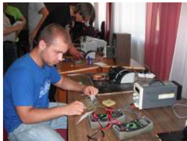
4. grupas audzēknis beidz pastiprinātāja lodēšanu. Tiek salodēts shēmas makets.